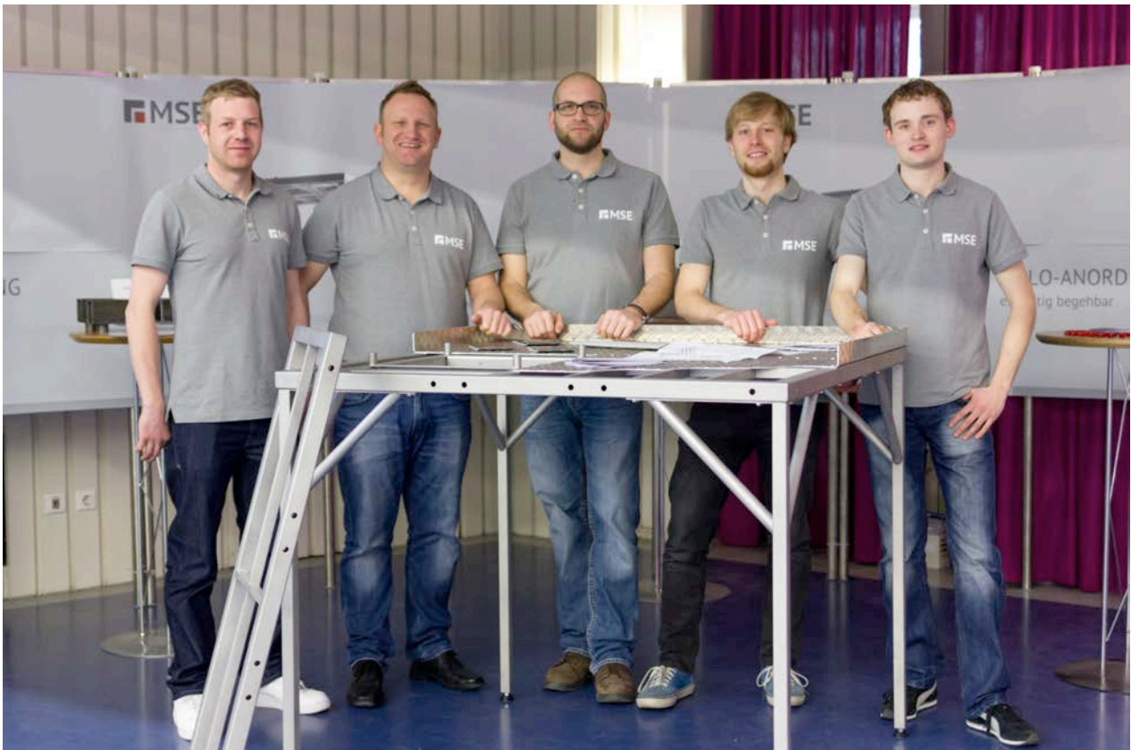
Die Gruppe präsentiert ihr gelungenes Projekt am "Tag der offenen Tür 2015"